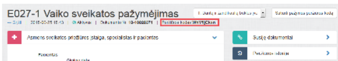
3 paveikslas. Sugeneruotas peržiūros kodas

Sistema sugeneruoja naują pažymos peržiūros e. sveikatos portale kodą, kuris rodomas atnaujintame medicininės pažymos peržiūros lange.