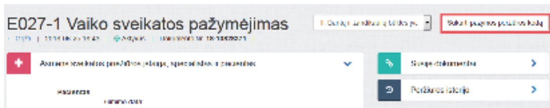
1 paveikslas. Sukurti pažymos peržiūros kodą