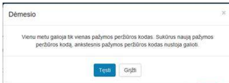
2 paveikslas. Pasirinkti tęsti veiksmą

Sistema sugeneruoja naują pažymos peržiūros e. sveikatos portale kodą, kuris rodomas atnaujintame medicininės pažymos peržiūros lange.